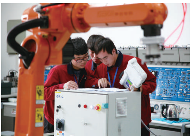
工业机器人技术应用大赛。