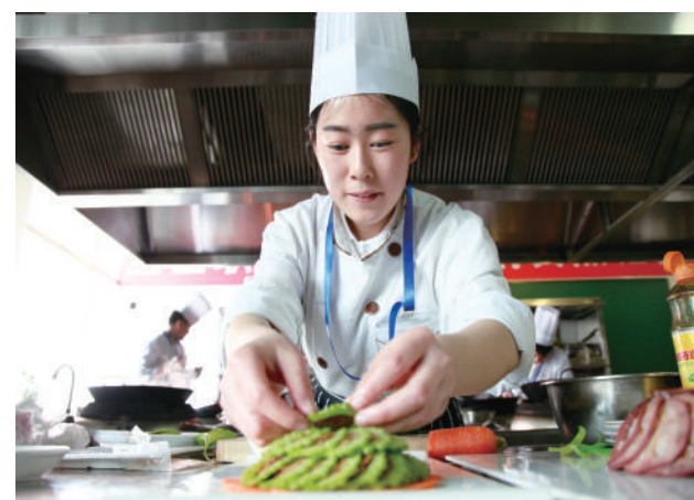
烹饪工艺与营养专业实训。